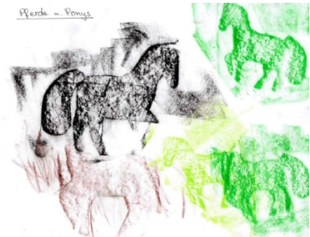
Pferde u Ponys