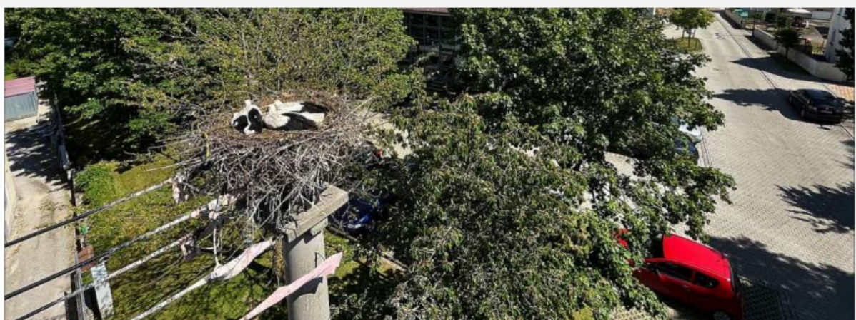
Kinderbett in luftiger Höhe: Direkt neben der Schule in Burgheim zieht ein Storchchenpaar auf einem Strommast dieses Jahr drei Junge groß.