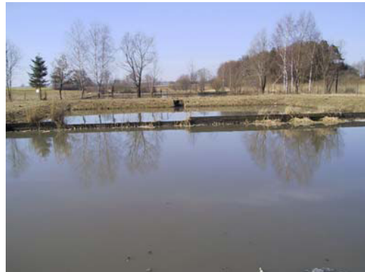
Teichanlage im OT Straß