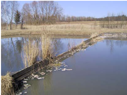
Teichanlage im OT Straß