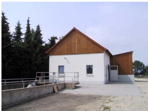
Rechengebäude mit Sandwaschanlagen der Kläranlage Burgheim