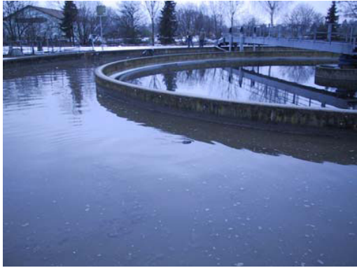
Das Klär- und Sandbecken der Kläranlage Burgheim

Der Markt Burgheim unterhält mit seinen 4.700 Einwohnern eine vollbiologische Kläranlage und 7 Teichanlagen.